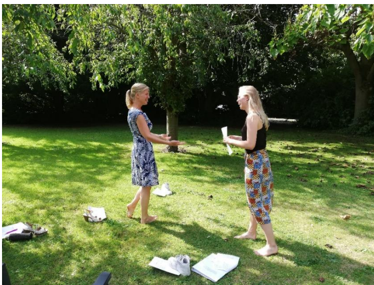
De foto's in deze brochure zijn genomen tijdens opleidingen voor professionals.

De opleiding richt zich tot psychologen en andere hulpverleners die op korte tijd het ACT-model willen leren kennen en er snel mee aan de slag willen kunnen in de praktijk. Dit kunnen professionals uit de gezondheidszorg vanuit de eerste, tweede of derde lijn zijn.