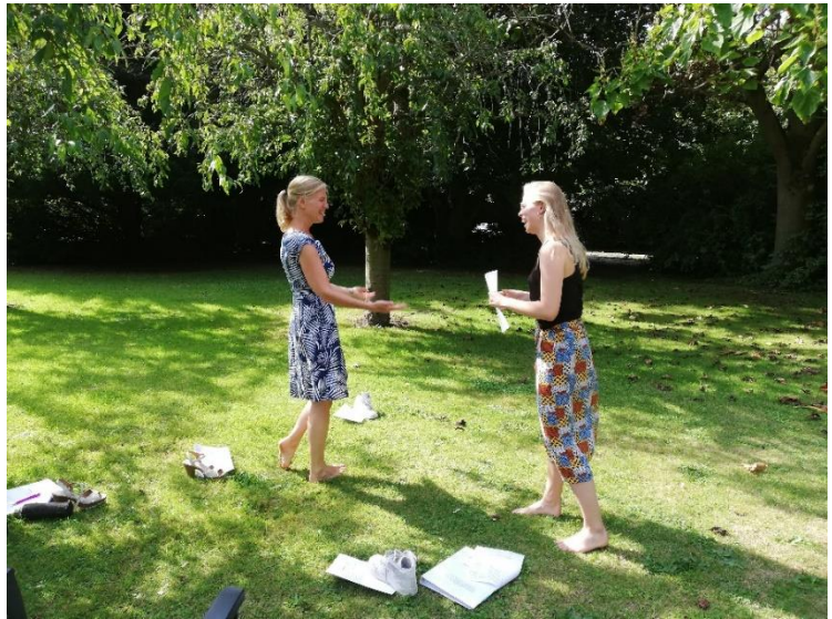
De foto's in deze brochure zijn genomen tijdens opleidingen voor professionals.

De opleiding richt zich tot psychologen en andere hulpverleners die op korte tijd het ACT-model willen leren kennen en er snel mee aan de slag willen kunnen in de praktijk. Dit kunnen professionals uit de gezondheidszorg vanuit de eerste, tweede of derde lijn zijn.